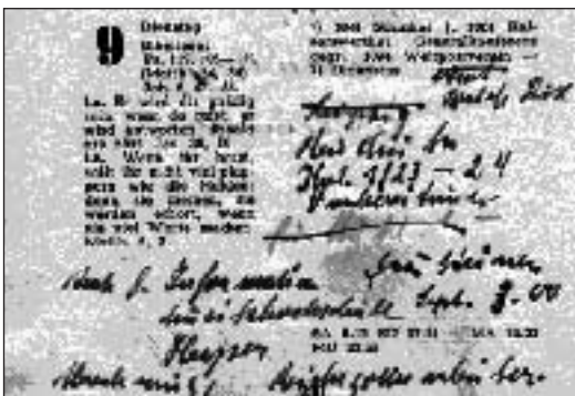
Eintrag Diensttagebuch vom 9. Okt. 1951: Folgende Notizen sind in ihm zu finden: Amt: für Information/Musikhochschule Hesper (?) Abrechnung Reichgottesarbeiter